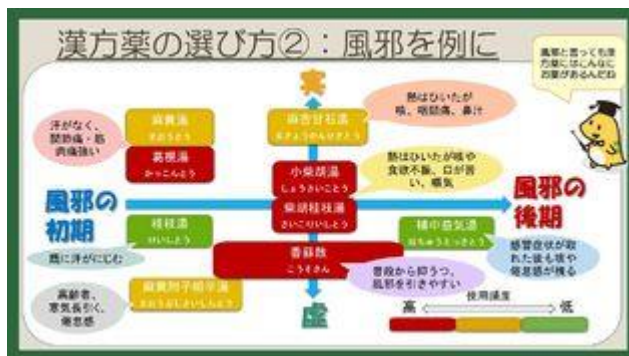
「はじめての漢方 E-learning」より(2)