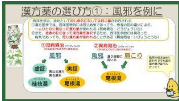
「はじめての漢方 E-learning」より(1)