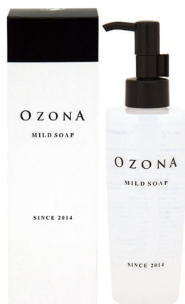
オゾナ マイルドソープ