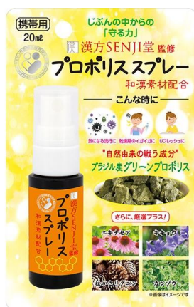
漢方 SENJI 堂監修のプロポリススプレー